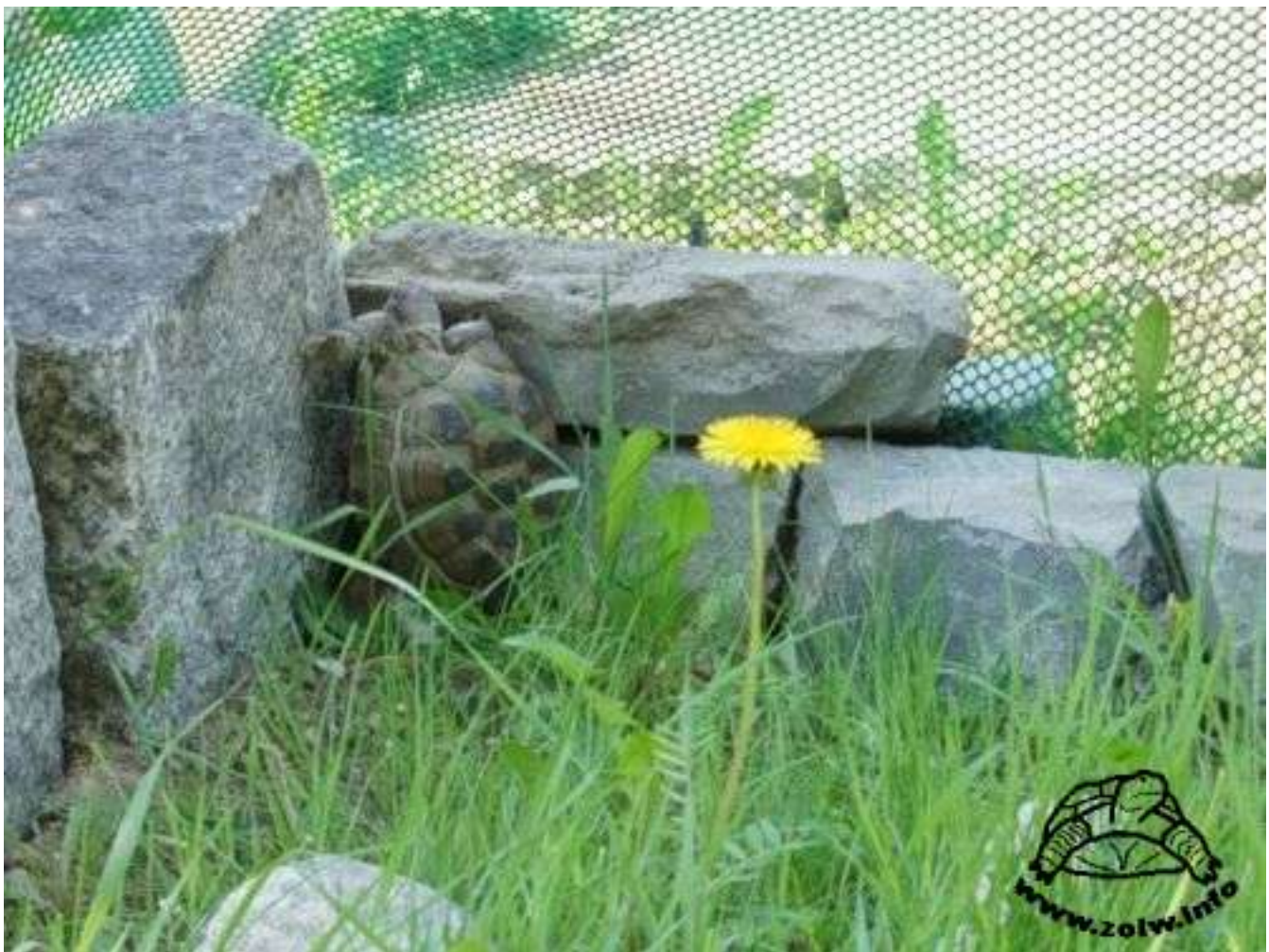
Powyżej: Żółw stepowy wspina się na ogrodzenie wybiegu.

Ważny jest również kształt wybiegu. Jeśli ma postać czworokąta, to dobrze jest, aby boki miały zbliżoną długość. Lepszy jest zatem równomierny kwadrat niż długi prostokąt, ponieważ żółw mniej odczuwa "obecność" ścian wybiegu, gdyż są od siebie bardziej oddalone. Dobrym rozwiązaniem są też wybiegi owalne. Niektórzy zalecają je nawet jako najlepsze, gdyż brak kątów czyni ścianki trudniejszymi do sforsowania. Jest to z pewnością racja, ale przy odpowiednio wysokich ściankach żółw nie poradzi sobie z przejściem ogrodzenia także w kątach. Ponadto owalny kształt wybiegu może ograniczać wybór materiałów na ogrodzenie i trudniej przykryć go siatką. Kąty wybiegu bardzo zachęcają żółwia do wspinaczki, co może być wspaniałą okazją do ruchu i ścierania się pazurów, jeśli wyrosły nadmiernie.