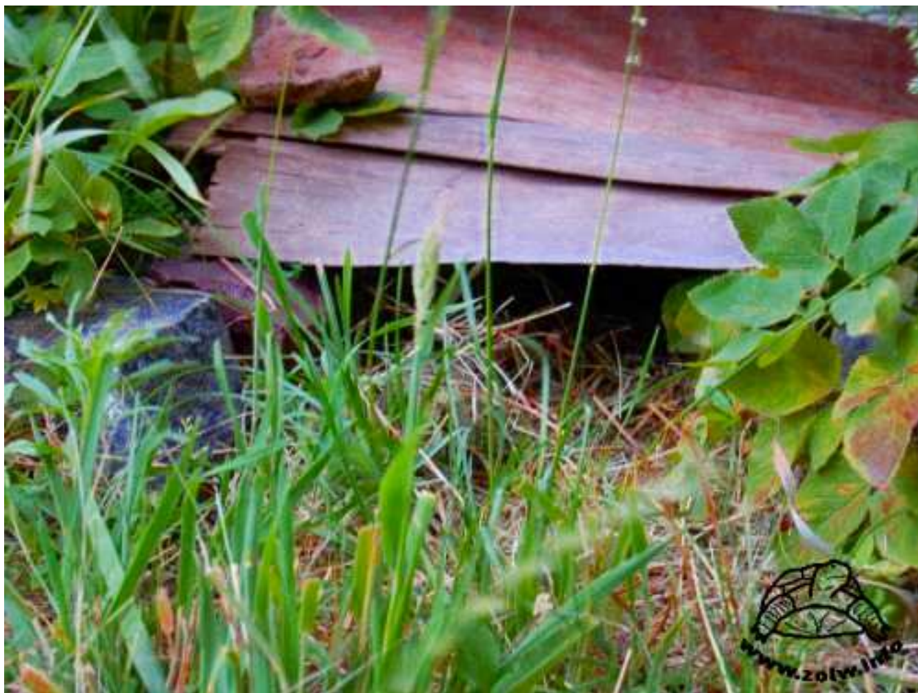
Powyżej: Prosta, niska kryjówka z bloczków kamiennych i sklejki.

Jeśli żółw nie przebywa na wybiegu całą dobę a jest zabierany na noc do domu, to praktycznym rozwiązaniem jest kryjówka przenośna. Pozwala zmniejszyć stres zwierzęcia związany z przenoszeniem, czy budzeniem i wyjmowaniem z kryjówki „statycznej”. Pamiętajmy aby nie przenosić żółwia trzymając go tylko za pancerz, bez zapewnienia podparcia dla kończyn. Jeśli musimy żółwia przenieść to najlepiej użyć do tego celu płaskiego, szerokiego zbiornika, a jeśli nim nie dysponujemy przytrzymajmy żółwia od spodu drugą ręką, aby czuł coś pod sobą. Przenośna kryjówka ma dodatkowo tę zaletę, że żółwia nie trzeba ruszać aby go spokojnie przenieść.