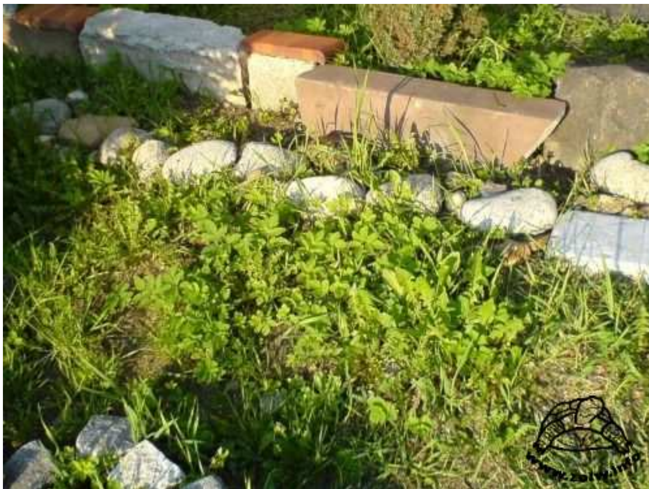
Powyżej: Fragment prostego wybiegu tymczasowego z kamiennym ogrodzeniem.

Kolejnym wariantem jest siatka z gęstymi oczkami. Nie jest to rozwiązanie najlepsze, gdyż żółw widząc przez siatkę dalszy obszar będzie uporczywie próbował się przez nią przedostać, co oczywiście nie znaczy, że innych ogrodzeń też nie będzie chciał przejść. Jednak korzystając naprawdę z wielkiego wybiegu nie zaobserwowałam nigdy prób wspinania się na deski czy kamienie, natomiast zainteresowanie siatką, która otaczała jedno drzewo przed dostępem żółwia, miało czasem miejsce. Siatka jest odradzana też z tego powodu, że może być łatwiej staranowana niż deska czy mur. Ziemia się z czasem może obsuwać lub obluźniać i w efekcie siatka może wypaść z pomiędzy palików albo się przewrócić pod naporem żółwia.