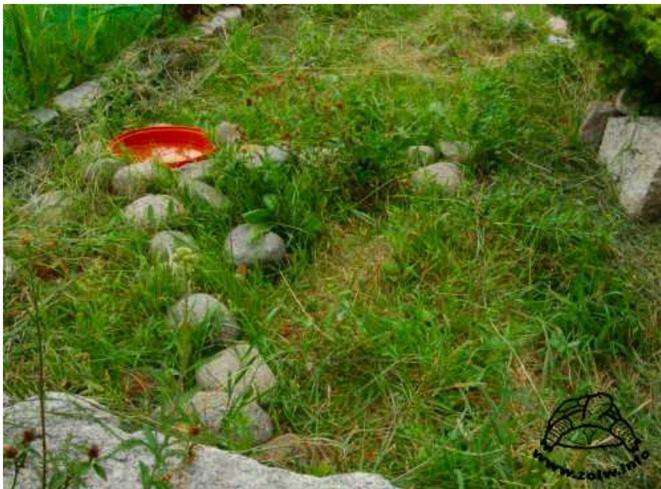
Powyżej: Fragment niewielkiego wybiegu dla żółwia. Widoczny basen i kamienie do wspinaczki.

Podobnie jak w terrarium, na wybiegu potrzebna jest również kryjówka. Żółwie lubią różnego rodzaju norki. Czują się w nich bezpiecznie i mogą odetchnąć od nadmiaru Słońca oraz spokojnie zdrzemnąć się nawet w ciągu dnia. Z tego względu musimy zapewnić żółwiowi kryjówkę, z której na pewno będzie chętnie korzystał. Sposobów wykonania kryjówki jest dużo. Może być to prosta budka z bloczków kamiennych przykryta drewnianym daszkiem, jak na zdjęciu poniżej. Może być to także znaleziony w lesie wydrążony pień lub wkopana w ziemię ceramiczna doniczka. Kryjówka powinna być dość głęboka, aby umożliwić schronienie się w niej całego żółwia. Dno kryjówki można wyłożyć suchymi liśćmi.